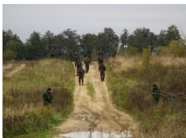
Kurs doskonalący dla funkcjonariuszy SG z jednostkami sił zbrojnych RP

Funkcjonariusze SG przygotowawali się do współdziałania z jednostkami Sił Zbrojnych RP w sytuacji prowadzenia wspólnych działań. Na bazie kętrzyńskiego ośrodka i 15. Giżyckiej Brygady Zmechanizowanej zrealizowano szereg zajęć praktycznych, m.in. z zakresu dowodzenia drużyną, pracy na mapie w standardach NATO, orientowaniem się w terenie bez mapy. Wspólnie z żołnierzami ćwiczyli taktykę i techniki poruszania się w terenie otwartym, jeziorno-lesistym, prowadzono rozpoznanie dróg i miejscowości w dzień i w nocy. Funkcjonariusze działali w składzie drużyn i sekcji rozpoznania przygotowując odpowiednie maskowanie, zajmowanie i przygotowanie stanowisk obserwacyjnych i stanowisk strzeleckich. Wspólne przedsięwzięcie Straży Granicznej i Sił Zbrojnych RP wpłynęło w dużym stopniu na zrozumienie zadań realizowanych przez służby.