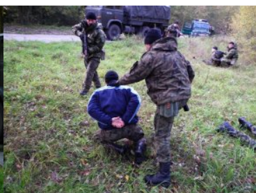
Kurs doskonalący dla funkcjonariuszy SG z jednostkami sił zbrojnych RP