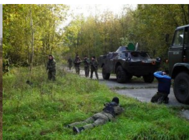
Kurs doskonalący dla funkcjonariuszy SG z jednostkami sił zbrojnych RP