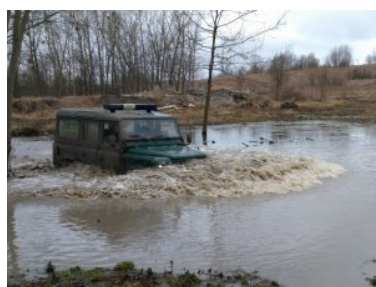
Doskonalenie jazdy po trudnym, podmokłym terenie

W szkoleniu wzięli udział funkcjonariusze z oddziałów: Morskiego, Podlaskiego, Nadwiślańskiego, Warmińsko-Mazurskiego i Komendy Głównej SG. Zajęcia prowadzili wykładowcy Zakładu Granicznego.