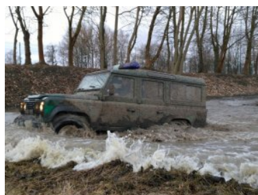
Doskonalenie jazdy po trudnym, podmokłym terenie