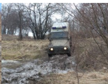
Doskonalenie jazdy po trudnym, podmokłym terenie