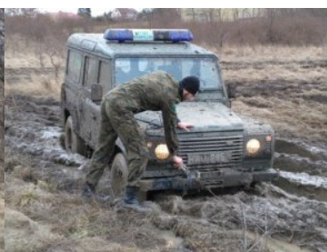
Doskonalenie jazdy po trudnym, podmokłym terenie