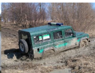
Doskonalenie jazdy po trudnym, podmokłym terenie