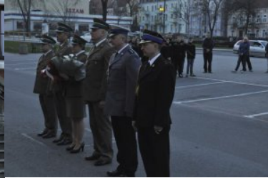
Uroczystości rocznicowe 10 kwietnia w Kętrzynie