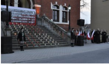
Uroczystości rocznicowe 10 kwietnia w Kętrzynie