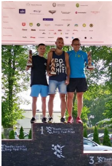
"Bieg Pod Prąd"