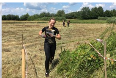
"Bieg Pod Prąd"