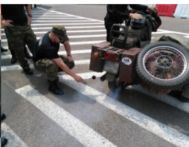
Kontrola stanu technicznego pojazdów w Przemysłu