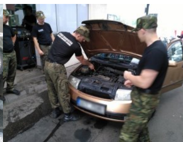
Kontrola stanu technicznego pojazdów w Przemysłu