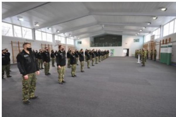
Zakończenie szkolenia w zakresie szkoły chorążych w CSSG