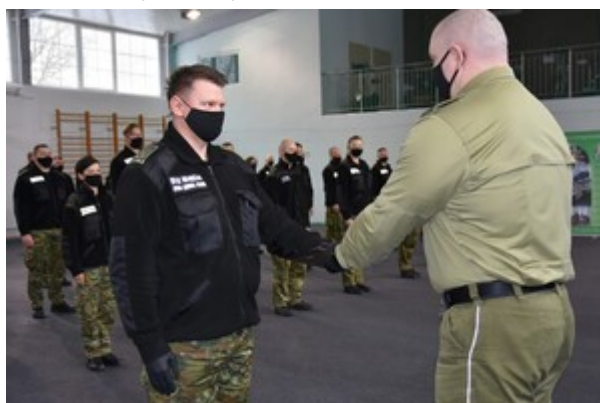
Zakończenie szkolenia w zakresie szkoły chorążych w CSSG