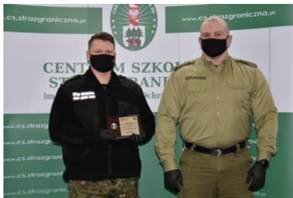
Zakończenie szkolenia w zakresie szkoły chorążych w CSSG