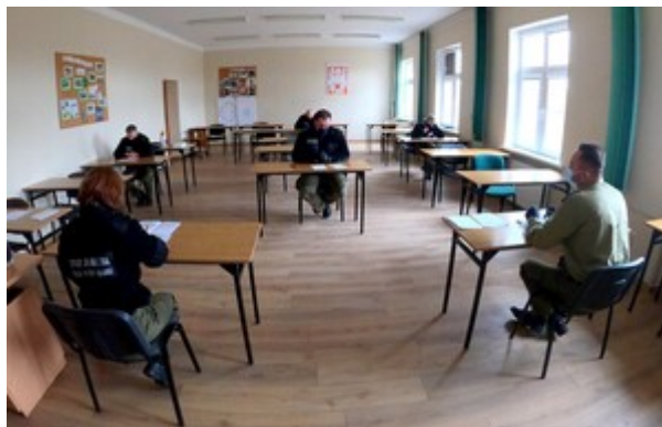
Zakończenie szkolenia w zakresie szkoły chorążych w CSSG