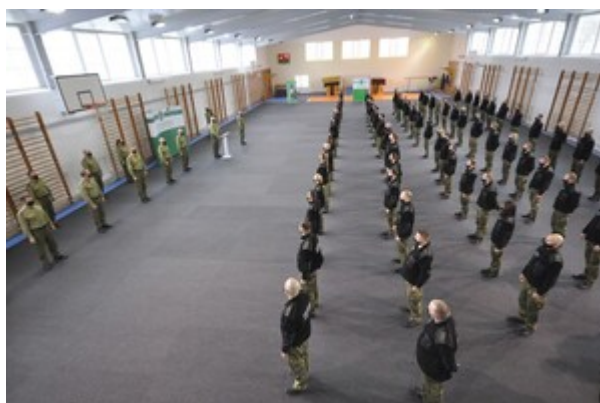
Zakończenie szkolenia w zakresie szkoły chorążych w CSSG