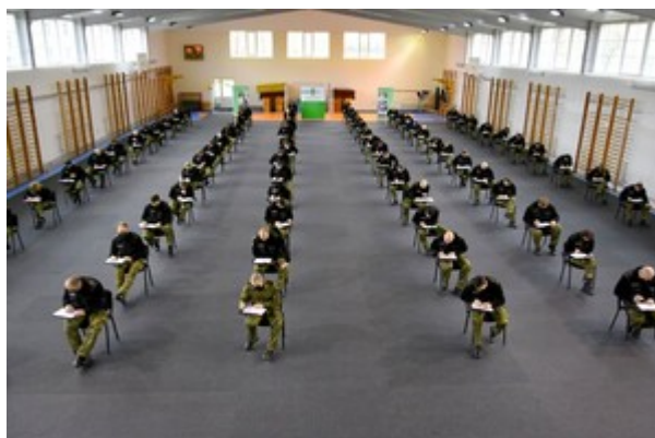
Zakończenie szkolenia w zakresie szkoły chorążych w CSSG