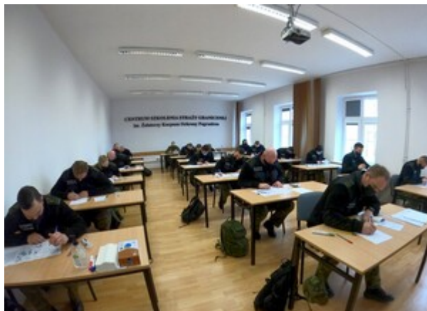
Zakończenie szkolenia w zakresie szkoły chorążych w CSSG