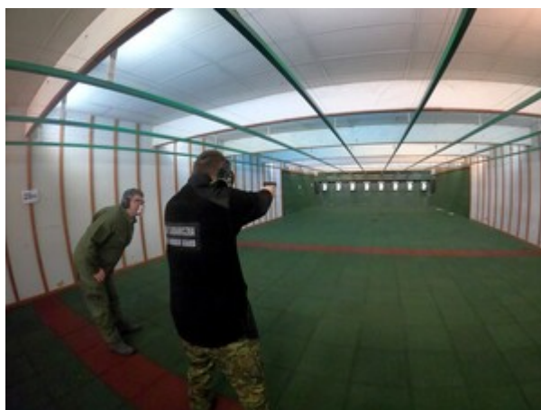
Zakończenie szkolenia w zakresie szkoły chorążych w CSSG