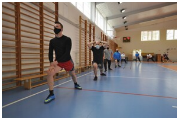
Zakończenie szkolenia w zakresie szkoły chorążych w CSSG