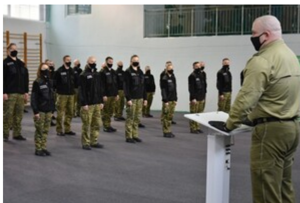
Zakończenie szkolenia w zakresie szkoły chorążych w CSSG