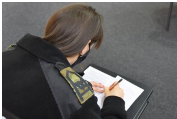
Zakończenie szkolenia w zakresie szkoły chorążych w CSSG