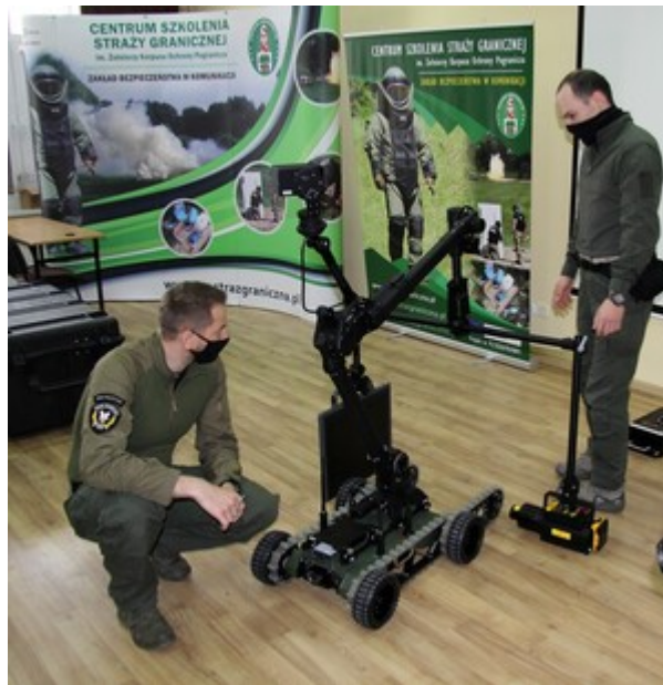
Robot pirotechniczny PIAP GRYF w Centrum Szkolenia SG