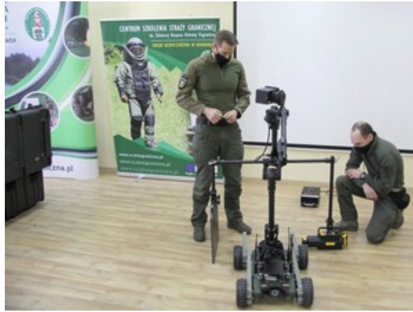
Robot pirotechniczny PIAP GRYF w Centrum Szkolenia SG