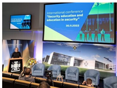
O bezpieczeństwie w międzynarodowym gronie

Uczestnicy konferencji zapoznali się również z ośrodkami badawczymi Estońskiej Akademii Nauk o Bezpieczeństwie w Paikuse i Väike-Maarja.