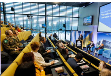
O bezpieczeństwie w międzynarodowym gronie