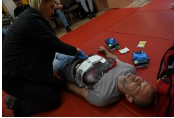
Pierwsza pomoc w praktyce