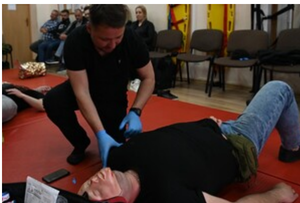
Pierwsza pomoc w praktyce

Szkolenie odbyło się w dniach 05-07 maja br.