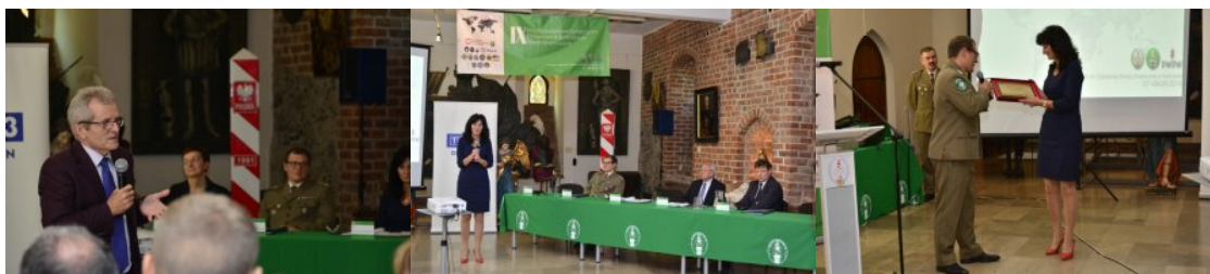
IX Międzynarodowe Sympozjum Ekspertów Kryminalistyki Służb Granicznych