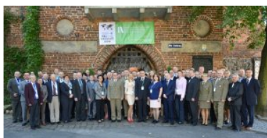
IX Międzynarodowe Sympozjum Ekspertów Kryminalistyki Służb Granicznych