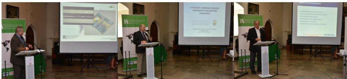
IX Międzynarodowe Sympozjum Ekspertów Kryminalistyki Służb Granicznych