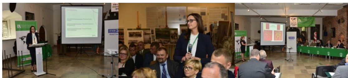
IX Międzynarodowe Sympozjum Ekspertów Kryminalistyki Służb